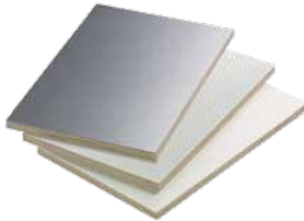
Metsä Wood Spruce havuvaneri